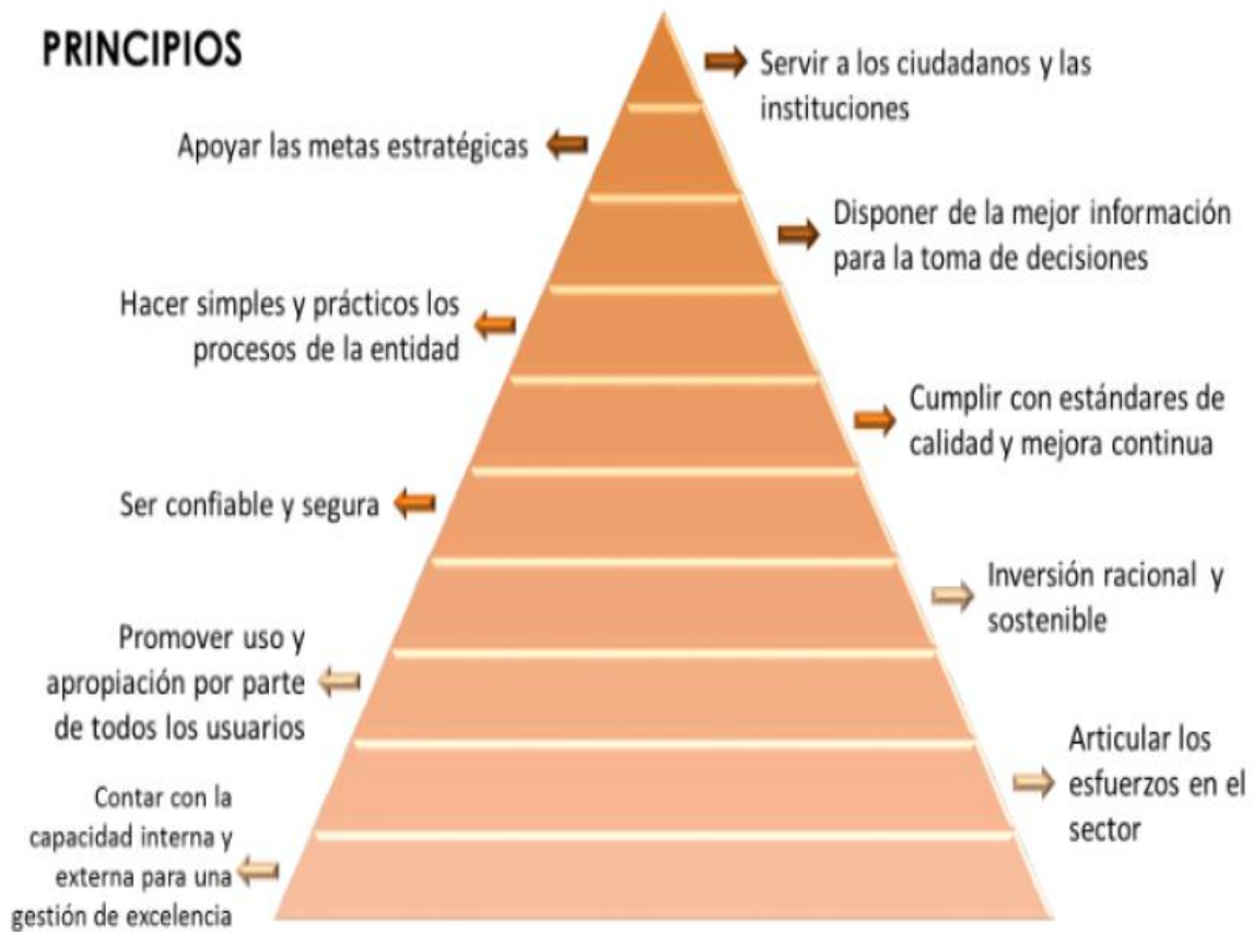
Grafica 2: Principios de la estrategia TI